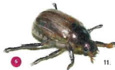
5 Mimela junii Il giugnino Mimela junii , 13-16 mm, possiede elitre di colore verde dorato e molti peli diffusi che non si distinguono in ciuffi bianchi. Ha una forma più ovale rispetto al coleottero giapponese.