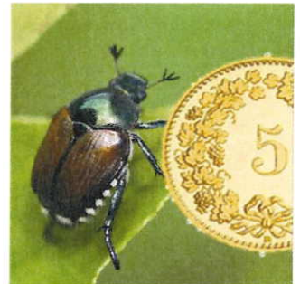
Figura 1: coleottero giapponese a confronto con una moneta di 5 cts.

Il coleottero giapponese ( Popillia japonica , Pj), classificato come organismo di quarantena prioritario, si distingue per la presenza di ciuffi pelosi bianchi (5 laterali e 2 più grandi nella parte posteriore) e per le sue piccole dimensioni, ovvero inferiori a una moneta di 5 cts (Figura 1). Esistono altri coleotteri molto simili coi quali ci si può confondere durante la determinazione. Nella Figura 2 sono illustrate le specie di insetti più comuni simili a Pj.