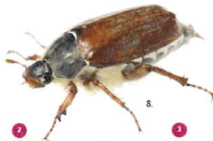
2 Melolontha melolontha Il comune maggiolino, 25-30 mm, non possiede ciuffi bianchi.