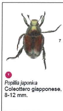
1 Popillia japonica Coleottero giapponese, 8-12 mm.